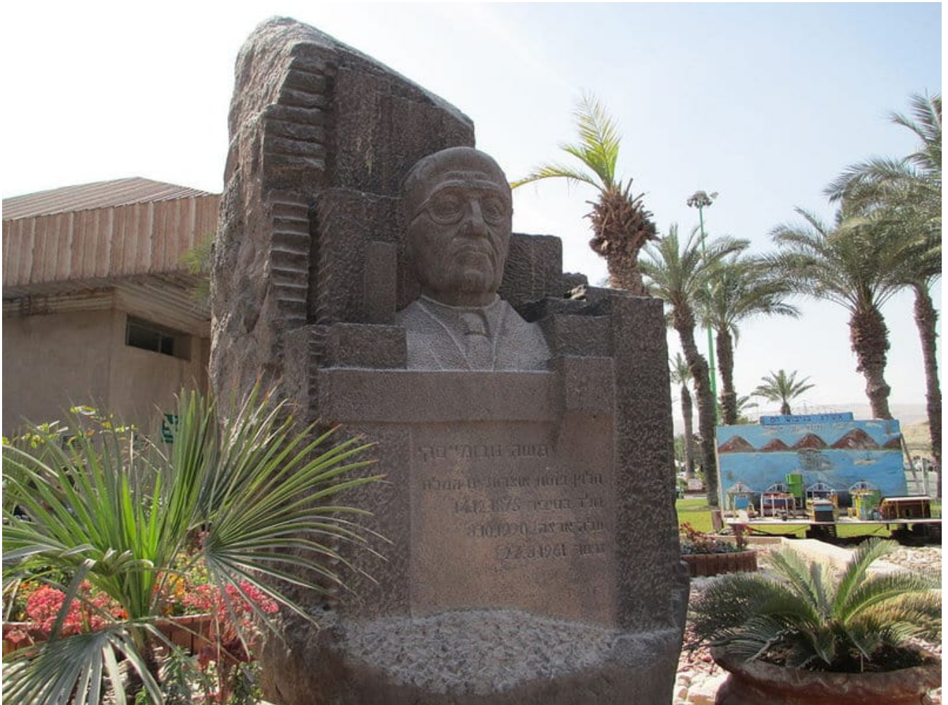
פסלו של משה נובומייסקי במפעלי ים המלח