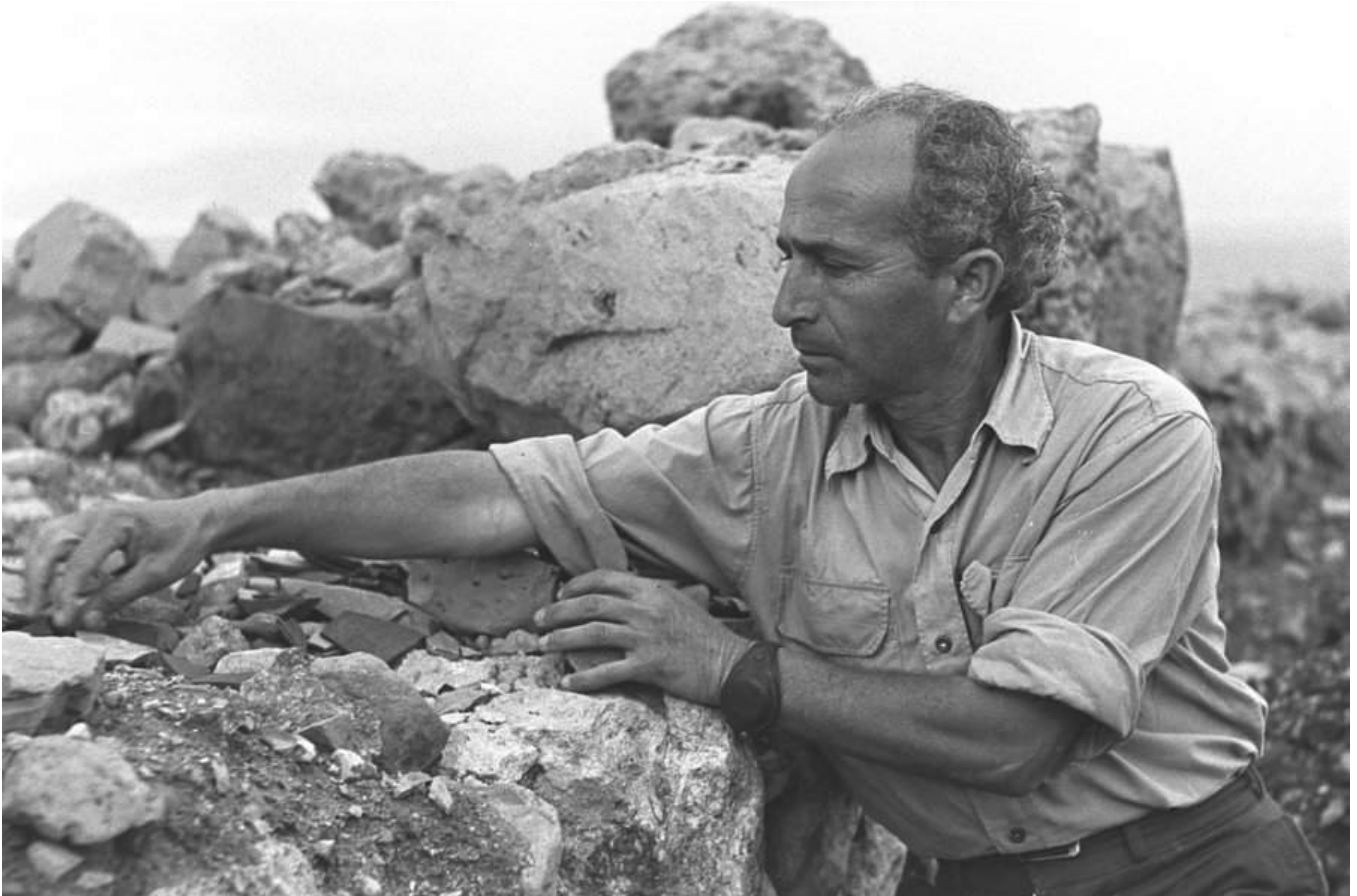
שמריה גוטמן באזור ים המלח

כאשר, במהלך מלחמת העצמאות, בהיותו קצין מודיעין בצה"ל (לפני כן היה מפקד המחלקה הערבית בפלמ"ח), התברר לו שאזור עין גדי ומצדה לא מתוכננים להיכבש במבצע המתוכנן "ייצוב", שנועד לקביעה וייצוב הגבולות בדרום הארץ, הוא הפעיל לחצים על יגאל אלון, מפקד חזית הדרום, להגיע גם אליהם, ובזכותו הם נכללו בשטחה של מדינת ישראל. שמריה העיד: "הסברתי לו את הערך, החשיבות של מדבר יהודה לארץ, את החשיבות של עין גדי [...] ואז הוא אמר לי: אם תיתן לי נימוק צבאי שצריך לעשות את זה בקשר עם כיבוש אילת, אני מוכן לקראת הדבר הזה, מפני שבפקודת המבצע אין כיבוש עין גדי [...], ואז הסברתי לו: אני אומנם לא מתוך הנימוק הצבאי רוצה שאנחנו ניקח את עין גדי, מתוך נימוקים של החשיבות של המקום הזה לנו. [...] אני אמרתי לו שכיבוש עין גדי זה נזר... זה ממש... מי שיעשה את זה, זה בשבילו - שהוא עושה איזשהו דבר שזה זיכרון עולם".