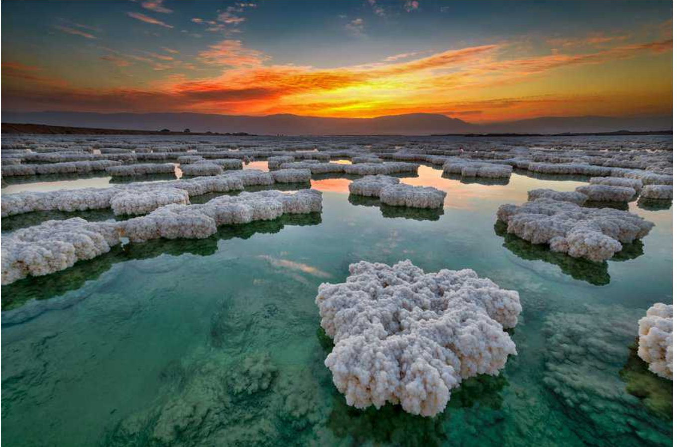
קריסטלים בים המלח.